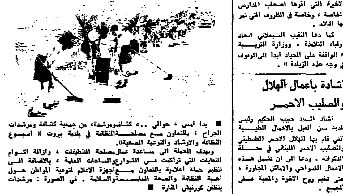
مجلس نظافة وارشاد وتوعية